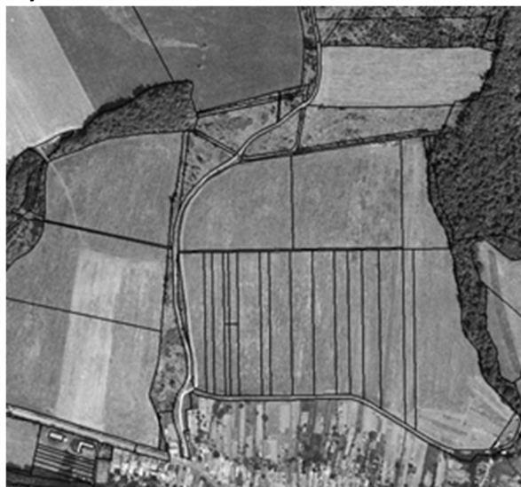
stav po pozemkových úpravách